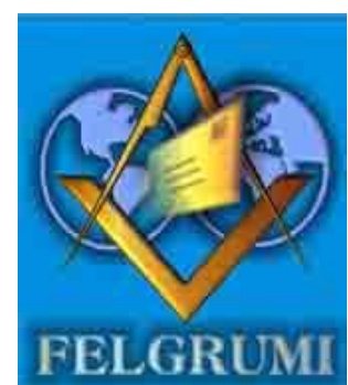
Federación de Listas Masónicas en Internet

En la página 21 de esta Edición, se encuentran los URL y correos electrónicos de las de las Listas que apoyan nuestra publicación y de las que somos los difusores de su quehacer. Los QQ:. HH:. pueden acceder a ellas cuando lo deseen y serán bienvenidos.