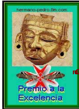
Con el apoyo difusional del Premio «Xipe Totec» del «hermano pedro»