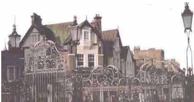
Verja del observatorio de Grenwich- Reino Unido