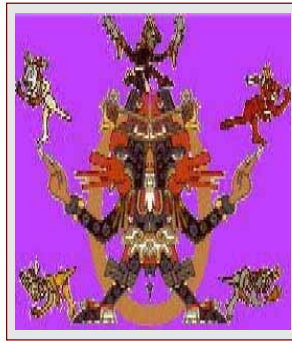
Distinguidos con el Premio Quetzacoatl a la calidad y contenido, otorgado por Pedro Antonio Canseco :