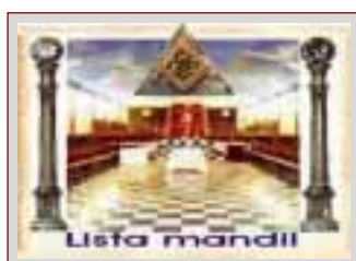
Lista [Mandil] mandil@elistas.net