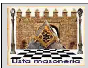
Lista [Masonería] masoneria@eListas.net